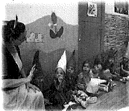
Iniciación a la Música