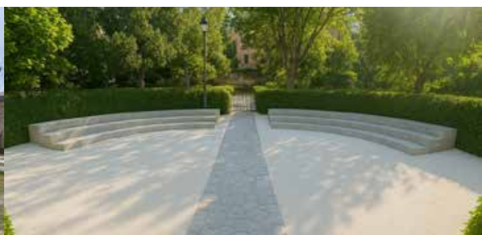
Kiosco tras la obra